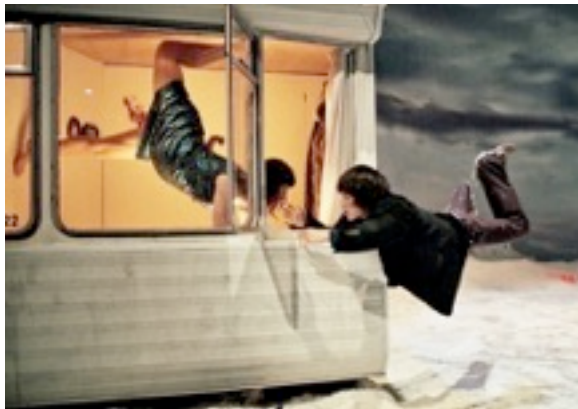
31 rue Vandenbranden - Peeping Tom