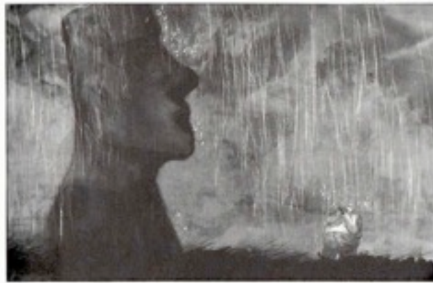
Blast - Manu Larcenet